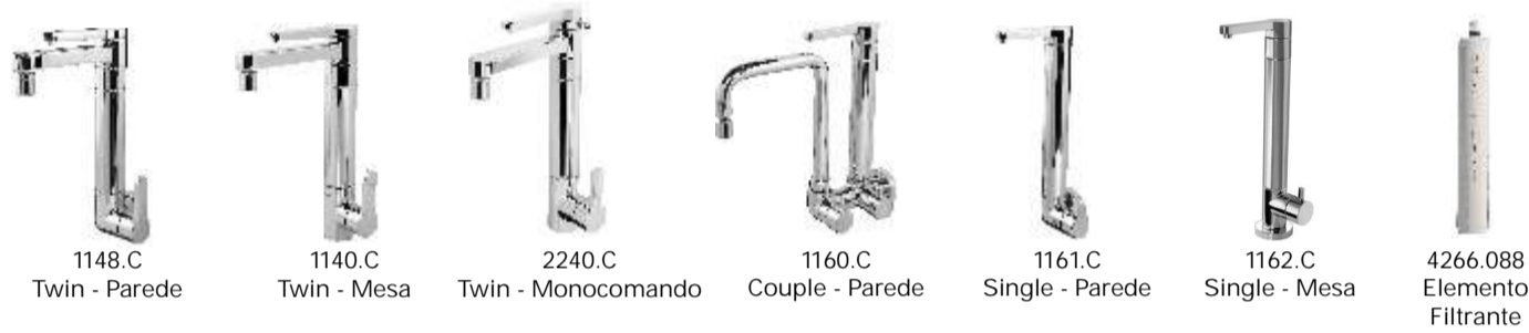
1148.C Twin - Parede