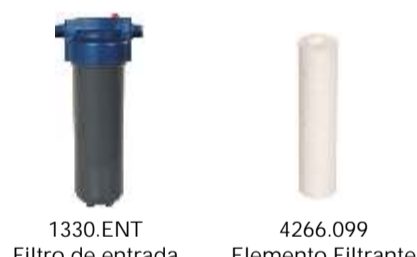
1330.ENT Filtro de entrada