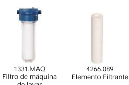
1331.MAQ Filtro de máquina de lavar